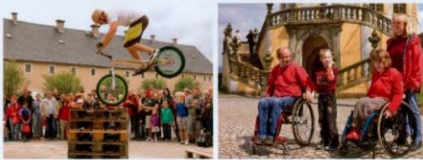
FESTUNG AKTIV - Spaß für die ganze Familie | Rollstuhlfahrer willkommen!

Kennen Sie das vielfältige Veranstaltungsangebot der Festung Königstein? Machen Sie mit bei den Outdoor-Erlebnis-Tagen FESTUNG AKTIV! , erleben Sie ein Orgelkonzert im Rahmen der Konzertreihe »Sonntagsmusik in der Garnisonskirche« oder genießen Sie die einzigartige Atmosphäre des Historisch-romantischen Weihnachtsmarktes »Königstein – Ein Wintermärchen« .