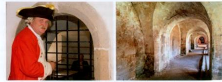
Schließkapitän Clemens | Unterirdische Kasemattenanlagen

Munitionsladesysteme, Kasematten und Tiefkeller – Verborgene Geheimnisse Festung Königstein Entdecken Sie 400 Jahre alte Tiefkeller, eine Caponnière, unterirdische Kasemattenanlagen u. v. m. Gebühr: 3 € für Erwachsene; Kinder bis 16 Jahre frei. Dauer: 90 Minuten