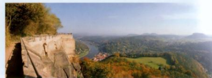
Ein Blick in die malerische Landschaft

Die Festung Königstein liegt am Malerweg , der noch heute auf einer Strecke von 110 km Künstler inspiriert und zu den beliebtesten Wanderrouten Deutschlands zählt ( www.malerweg.de ).