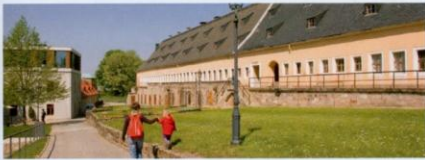
Das Offizierskasino und die Alte Kaserne

Eingebettet in die bizarre Felslandschaft der Sächsischen Schweiz thront weithin sichtbar auf einem Tafelberg die Festung Königstein. Einst eine unbezwingbare Wehranlage, lädt sie heute zum »Abenteuer Festung« ein. Entdecken Sie auf einer Fläche von 13 Fußballfeldern mehr als 50 imposante Bauwerke und ausgedehnte Grünanlagen.