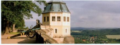
Die Friedrichsburg mit der einzigartigen »Maschinenfakel«

Suchen Sie einen exklusiven Ort für Ihre unvergessliche Feier? Laden Sie Verwandte, Freunde oder Geschäftspartner ein in die Friedrichsburg – das barocke Lustschlösschen mit dem exquisiten Interieur und der einzigartigen »Maschinenfakel«. Feiern und tagen können Sie außerdem in den Gewölbten der Hornkasematten oder im rustikalen Saal der Magdalenenburg (Mietanfragen: 035021 64-606).