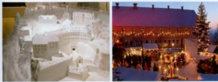
Ausstellung in der Magdalenenburg | Der Historisch-romantische Weihnachtsmarkt

Früher lebten hier Soldaten mit ihren Familien wie in einer kleinen Stadt. Erkunden Sie die riesige Anlage interaktiv an einem Festungsmodell in der Magdalenenburg , beobachten Sie Finanzbeamte im Schatzhaus oder schauen Sie in eine Gefängniszelle des 18. Jahrhunderts.