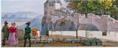
Friedrichsburg, I.C.A. Richter, Colorierte Radierung, Anfang 19. Jh. (Ausschnitt)

Die 247 m hoch über der Elbe gelegene Bergfestung bietet eine Reihe von Superlativen: Neben dem tieftsten Brunnen in Sachsen (152,5 m), der ersten sächsischen Garnisonskirche (1676) und der ältesten erhaltenen Kaserne Deutschlands (1589) gibt es hier seit 2011 ein weiteres Highlight – das Königsteiner Riesenweinfass . Eine moderne Installation aus Glas, Stahl, Licht und Musik zeigt im Maßstab 1:1 die gigantischen Dimensionen des legendären Weinfasses Augustus des Starken (238.600 l).